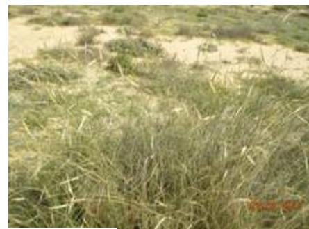
marais salé : région côtière centre sud