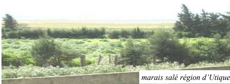
marais salé région d'Utique